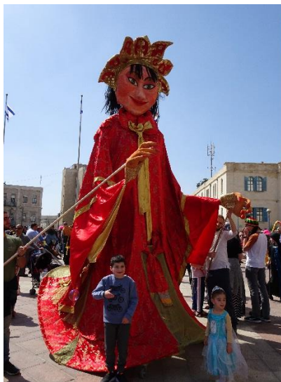
Purim-juhlan tunnelmia maaliskuun alussa