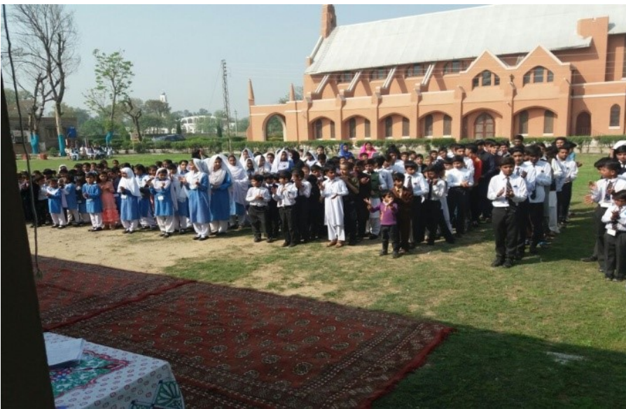
Pyhän Marian yläkoululaisia (vas.) ja koulurakennus (alla)

Kuvatestit: Elisa Nousiainen